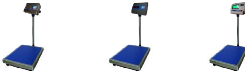
МП 60 ВДА Ф-2 (20; 400x500)

Общий вид весов представлен на рисунке 1.