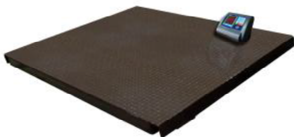
МП 2000 МЕДА Ф-1 (1000; 1500x1500)