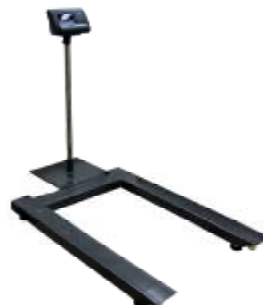
МП 600 ВЕДА Ф-1(200; 1200x800)